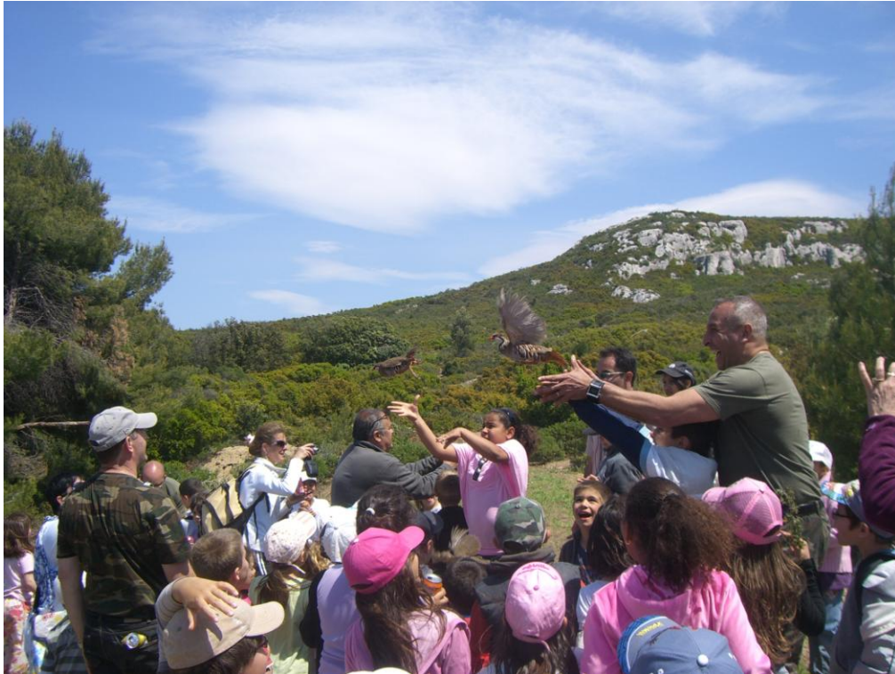
Les joies du lâcher, un plaisir partagé.