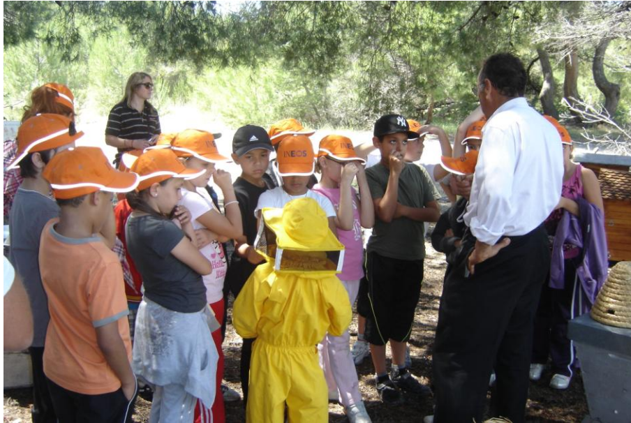
Les enfants sont attentifs aux explications de l'apiculteur.

En fonction du budget, nous espérons pouvoir offrir à chaque enfant un pot de miel.