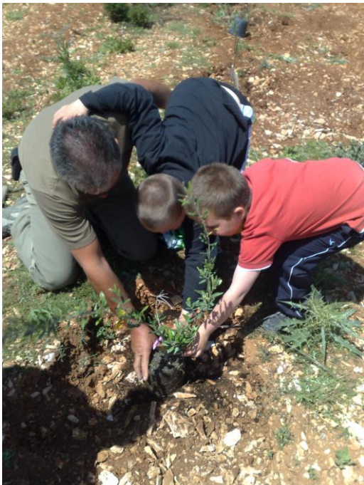
Bel exemple de solidarité...