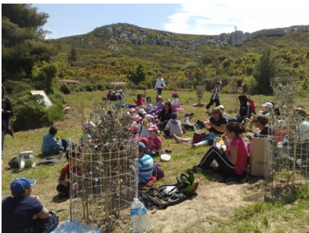
Le pique-nique des enfants

Après un petit effort, les enfants arrivent. .... Leur réconfort, un petit déjeuner bien mérité.