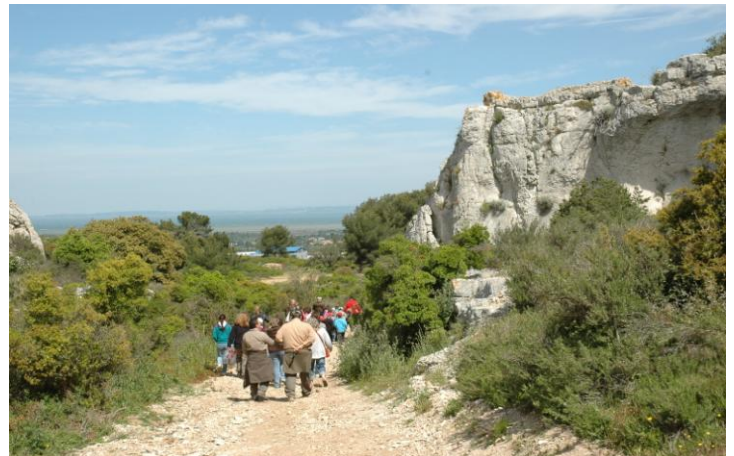
C'est parti pour la balade.