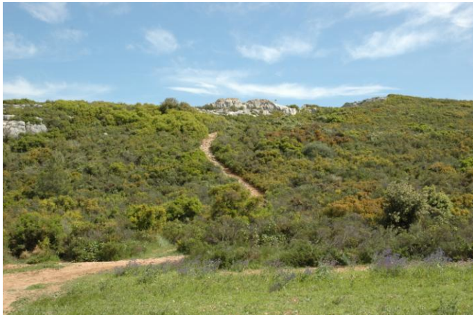
De beaux sentiers de découverte

Nous mettons à profit la beauté des lieux pour faire une balade et faire découvrir aux enfants la flore des collines. Cette balade est encadrée par les bénévoles du RCME, les parents d'élèves et les maitres d'école.