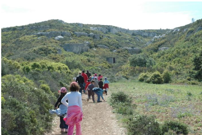
La beauté des lieux ferait vite oublier l'aspect éducatif, mais les maitres sont là pour veiller au grain.