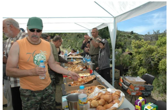
Le repas des adultes.