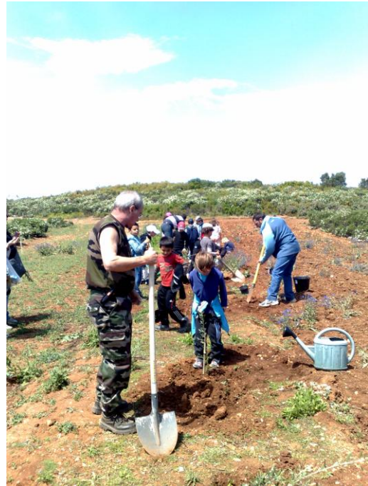
Les élèves plantent les oliviers avec l'aide des « grands »