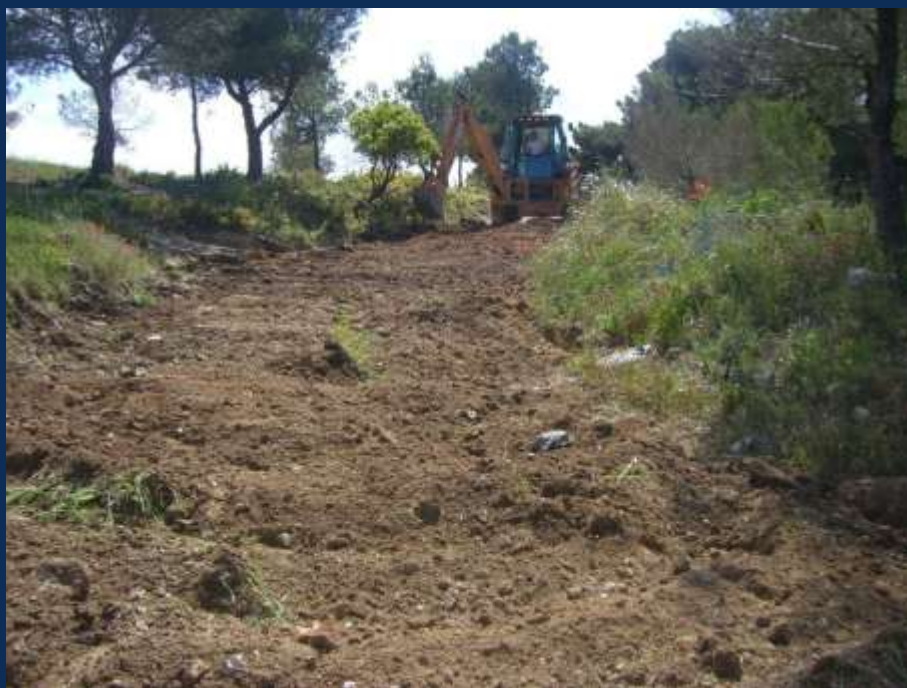
Entrée en action du tractopelle ...