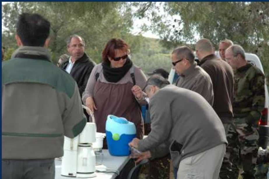
Café chaud pour les adultes ...