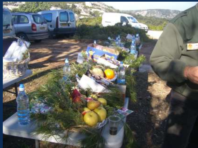
Boissons, fruits frais, viennoiseries ...