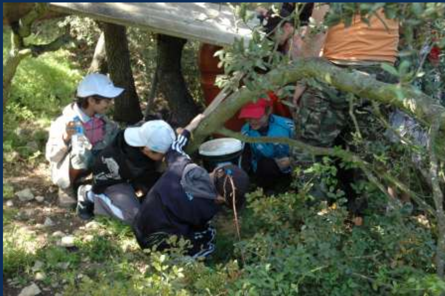
Mangeoire anti-gaspi ...