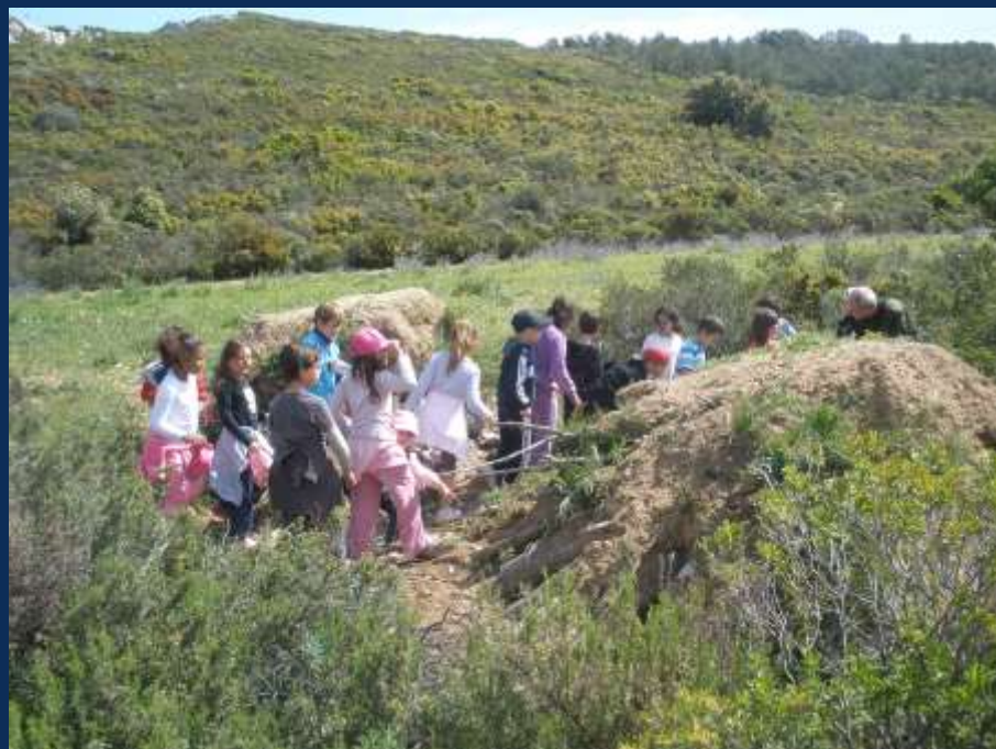
Garenne artificielle ...